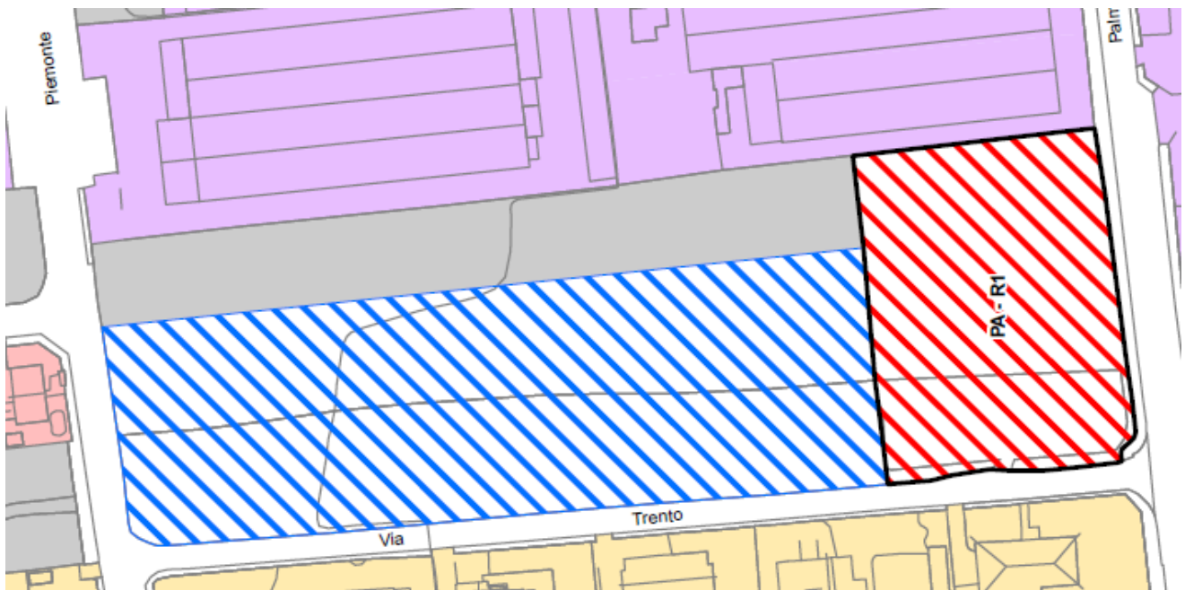
(02) - estratto dal P.G.T. 2014 (Piano di Governo del Territorio)