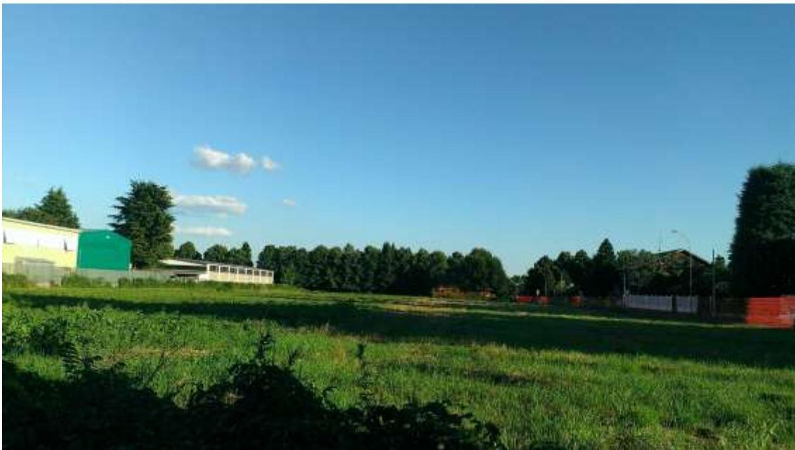
Immagine da via piemonte direzione sud – 19 aprile 2015.