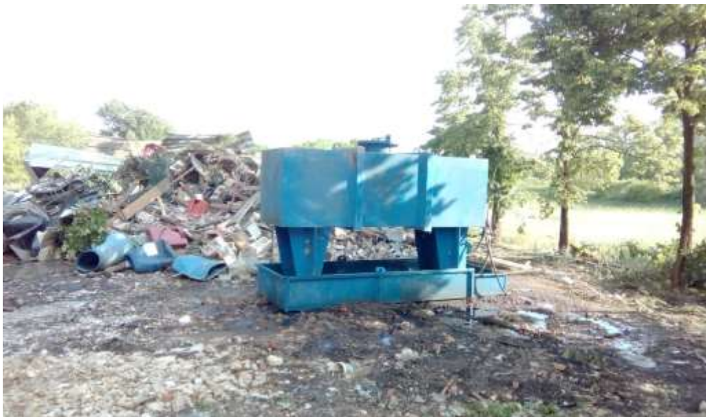
Immagine 3 - scattata martedì 7 giugno 2017 Vasca/cisterna / liquidi dispersi/ misto macerie/ misto materiali vari