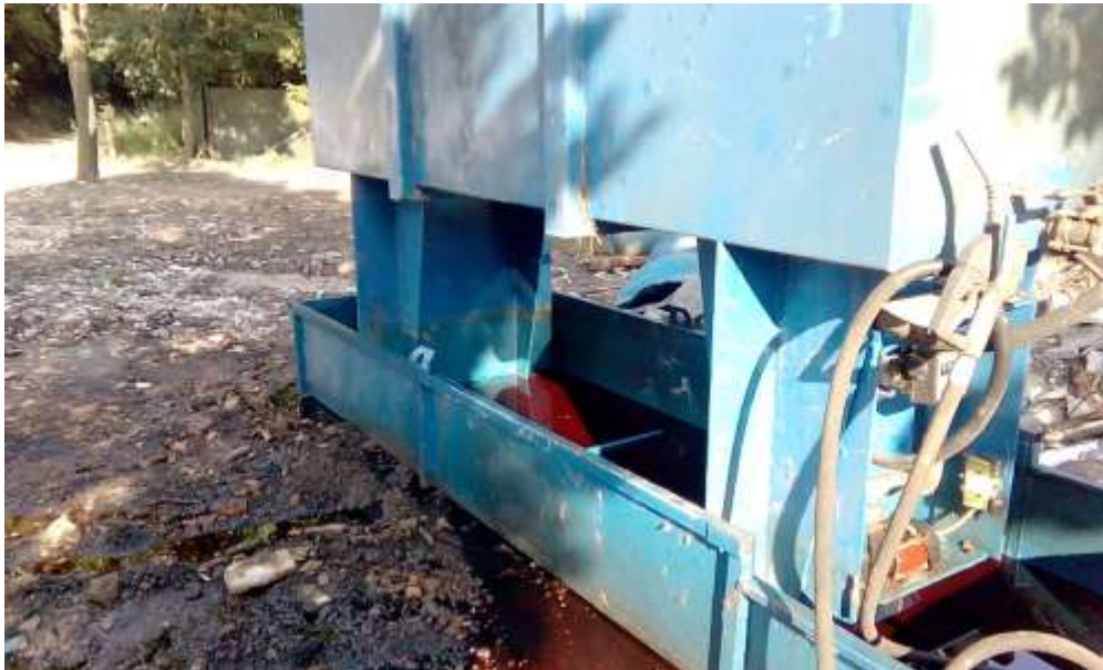
Immagine 1 - scattata martedì 7 giugno 2017 Vasca-cisterna + liquidi dispersi nel terreno