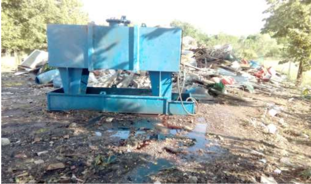
Immagine 2 - scattata martedì 7 giugno 2017 Vasca/cisterna / liquidi dispersi/ misto macerie/ misto materiali vari

Qualche ente pubblico ha controllato Quartiere Mascagni – Aree nel Parco delle Groane Potenziale danno ambientale