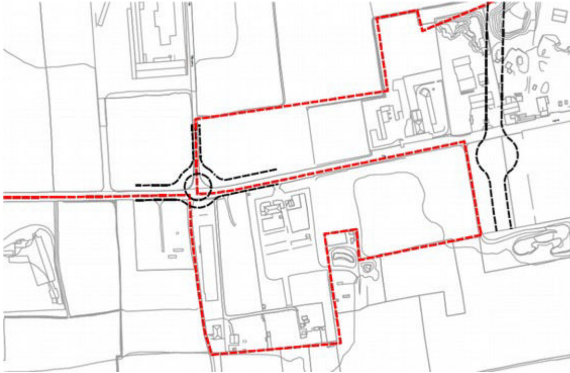
Estratto dal PGT 2014